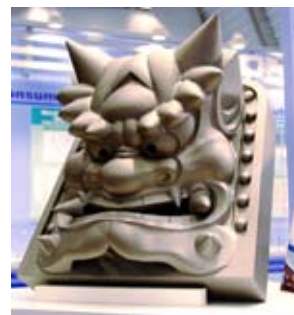
材料開発と加工技術の追求により誕生したチタン鬼飾り

加工性の追求とあいまって、陽極酸化法やイオンプレーティング法による豊かな発色、アルミナブラスト等の表面処理技術による味わい豊かな質感等、チタンでしか表現できない格調の高い意匠性を実現しています。